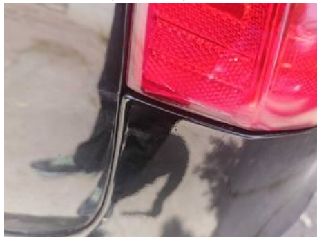
Bouclier arrière (Peinture)