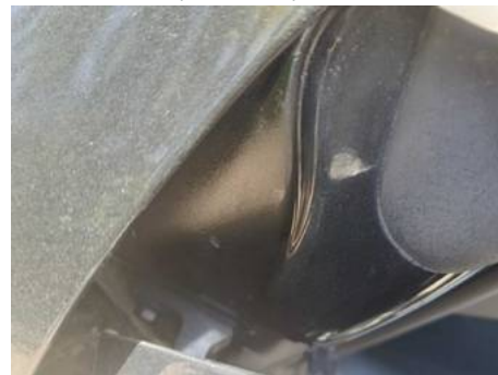
Bas de caisse droite (Peinture)