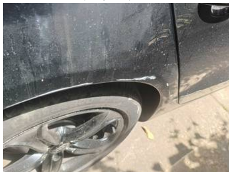
Aile arrière droite (Rayure)