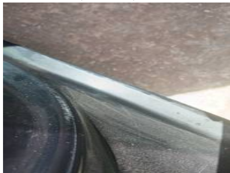
Bas de caisse gauche (Peinture)