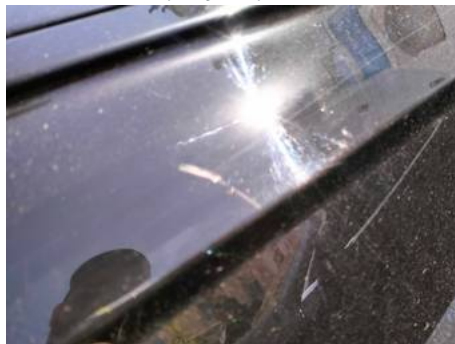
Aile avant gauche (Rayure)