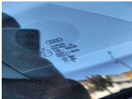
Pare-brise (Autre Défaut)