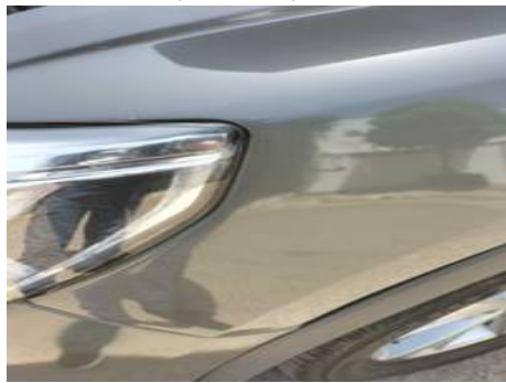
Aile avant gauche (Peinture)