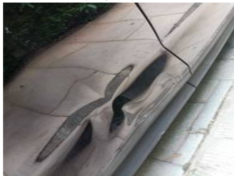
Porte arrière droite (Rayure)