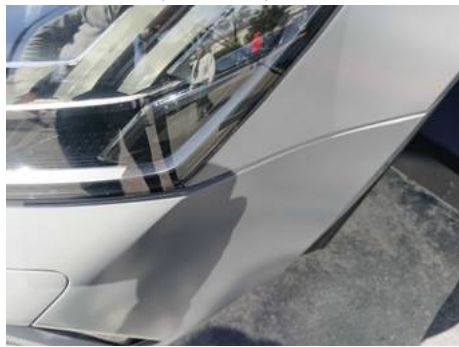
Bouclier avant (Peinture)