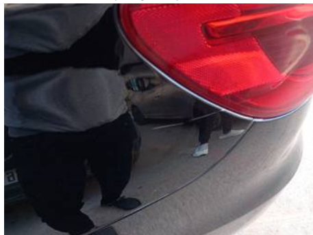
Aile arrière gauche (Rayure)