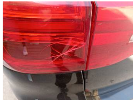
Phare arrière gauche (Impact)