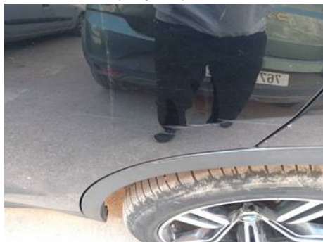
Porte arrière gauche (Rayure)