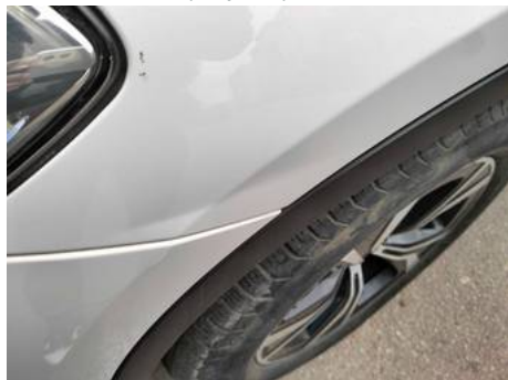
Aile avant gauche (Impact)