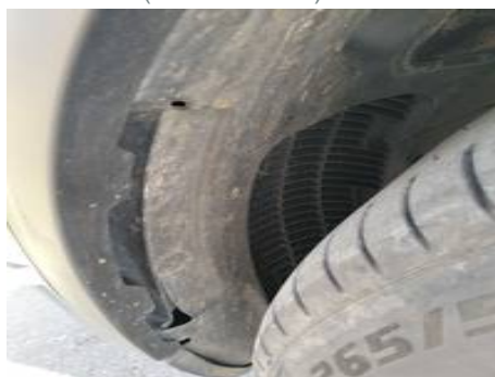
Bouclier avant (Autre Défaut)