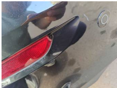
Bouclier arrière (Impact)