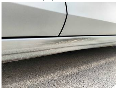
Bas de caisse droite (Impact)