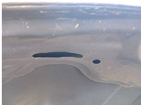
Garniture de siège avant (Trou)