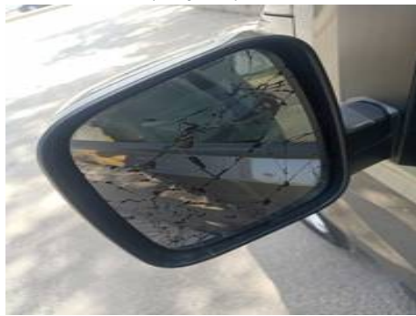
Rétroviseur extérieur gauche (Rayure)