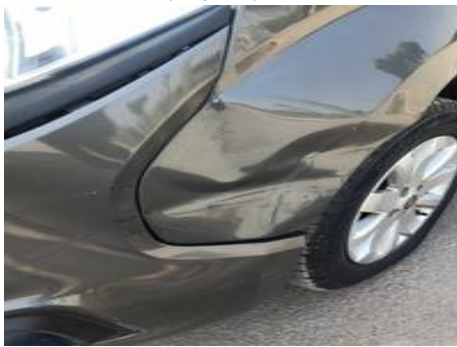
Aile avant gauche (Impact)