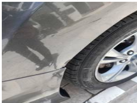
Aile arrière droite (Rayure)