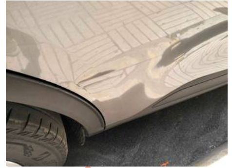
Porte arrière droite (Impact)