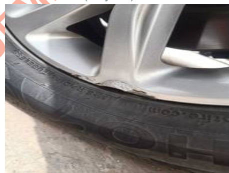
Jante alliage avant gauche (Rayure)