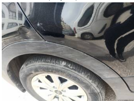
Aile arrière gauche (Rayure)