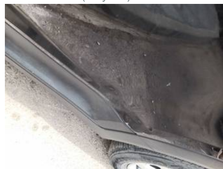
Porte arrière gauche (Rayure)