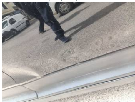
Porte arrière droite (Rayure)