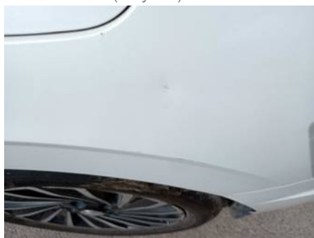
Aile arrière gauche (Rayure)