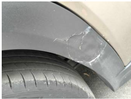
Porte arrière droite (Défaut aspect)