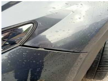
Bouclier avant (Rayure)