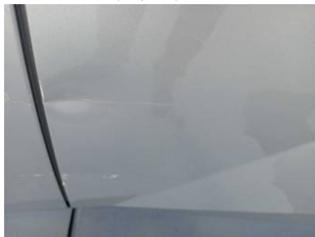
Porte arrière gauche (Impact)