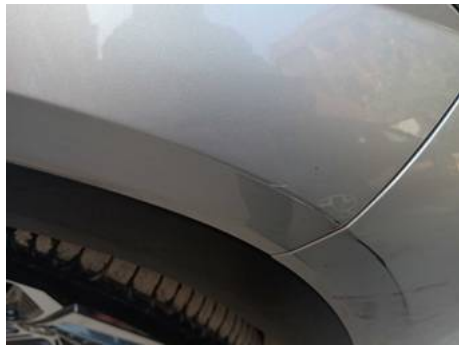
Aile avant droite (Rayure)