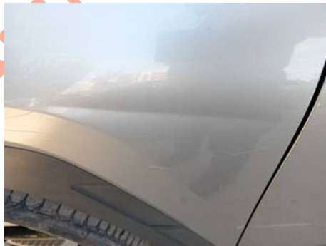
Aile avant gauche (Impact)