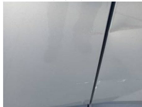
Porte avant gauche (Rayure)