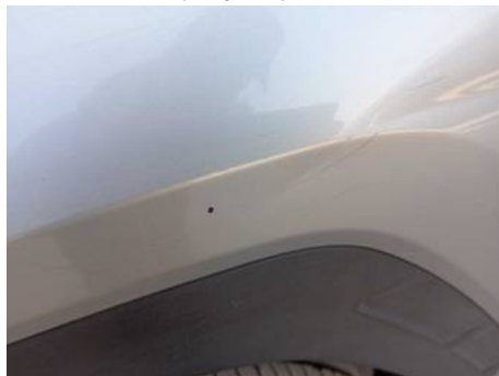
Aile avant gauche (Rayure)