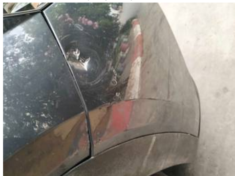
Aile avant droite (Impact)