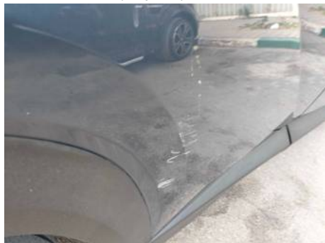
Porte arrière droite (Impact)