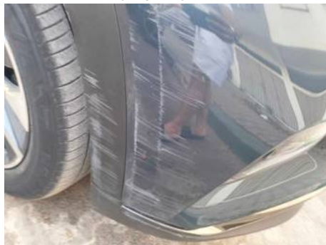
Aile avant droite (Impact)