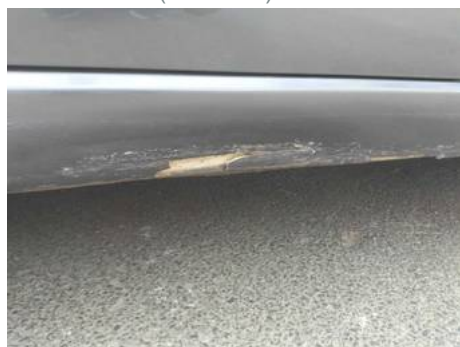
Bas de caisse droite (Peinture)