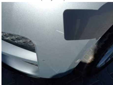
Bouclier avant (Rayure)