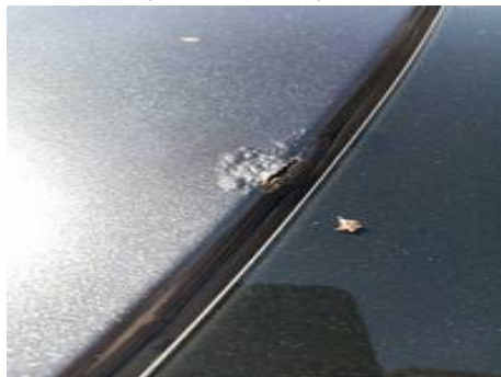
Toit (Autre Défaut)