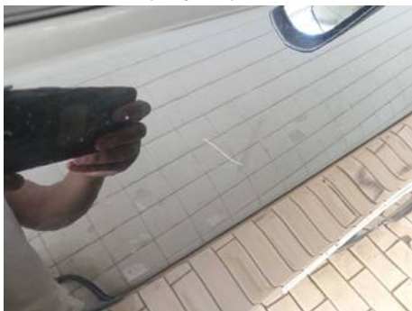
Porte avant droite (Rayure)