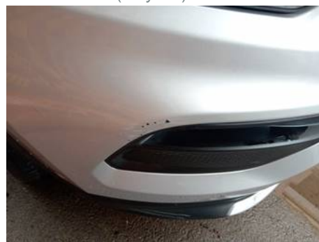
Bouclier avant (Rayure)