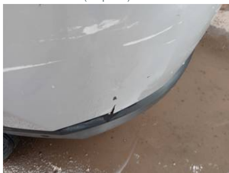
Bouclier arrière (Impact)