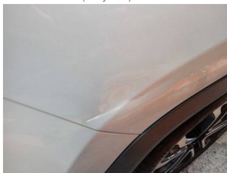
Aile arrière droite (Rayure)