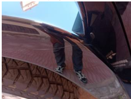
Aile avant gauche (Rayure)