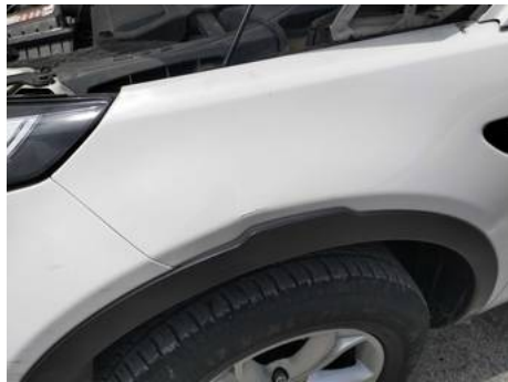
Aile avant gauche (Rayure)