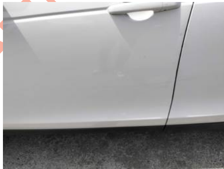
Porte avant gauche (Rayure)