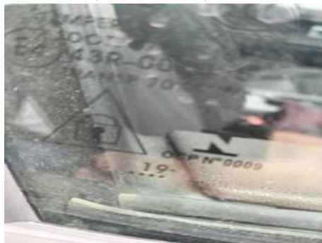
Vitre latérale avant droite (Autre Défaut)