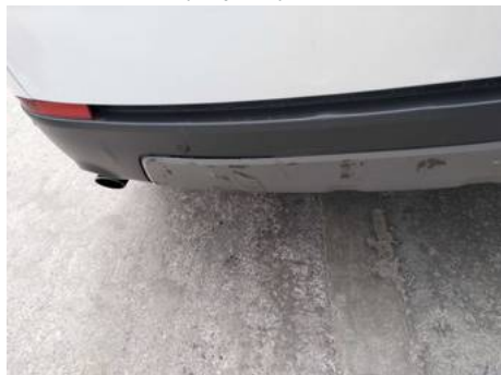
Bouclier arrière (Impact)