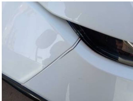
Bouclier avant (Impact)