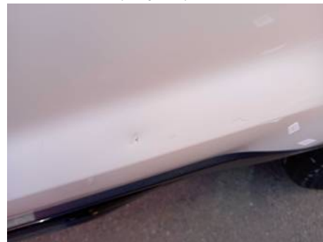
Porte arrière gauche (Rayure)