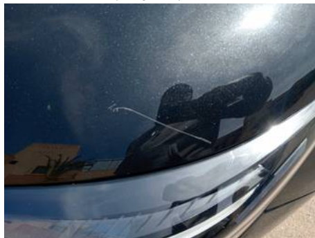
Porte avant droite (Rayure)