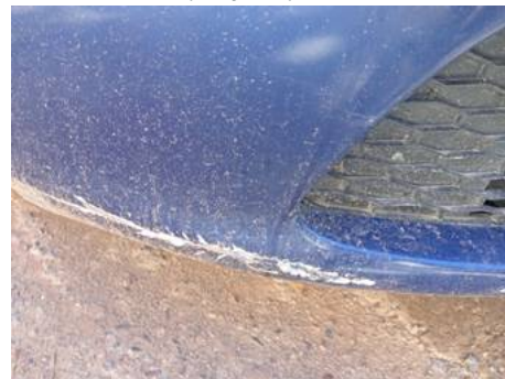
Bouclier avant (Rayure)