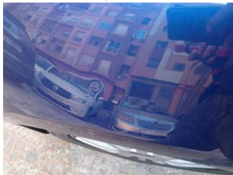
Aile avant gauche (Rayure)