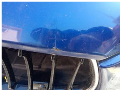
Bouclier avant (Impact)