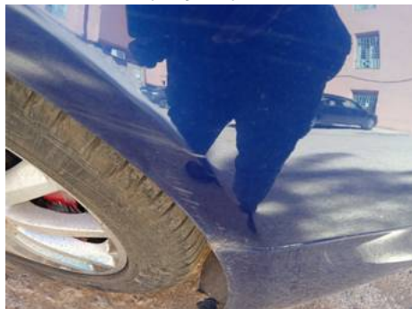
Aile avant droite (Rayure)