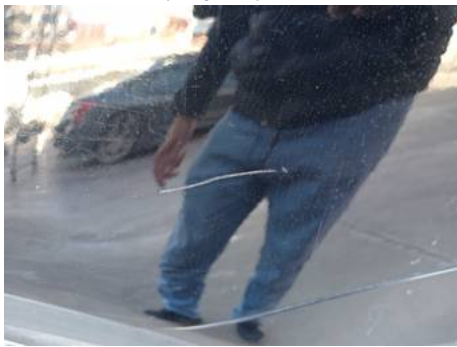
Aile arrière gauche (Rayure)