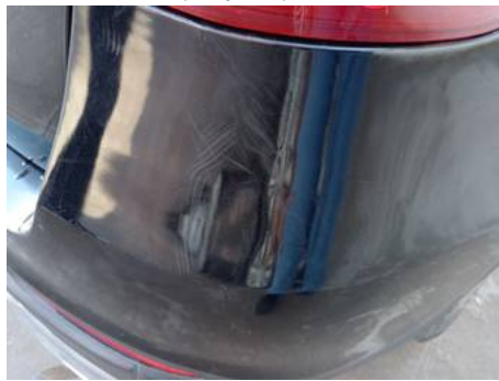
Bouclier arrière (Rayure)