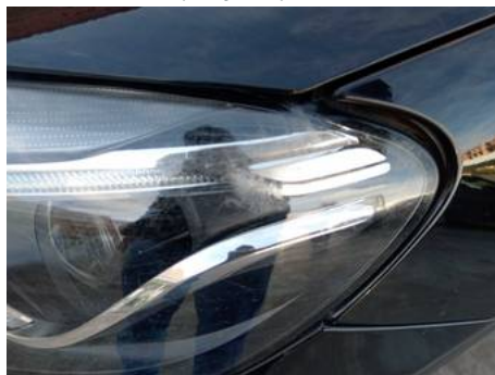
Phare avant gauche (Rayure)