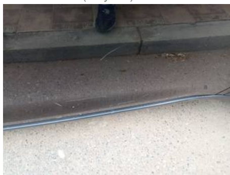
Porte avant droite (Rayure)