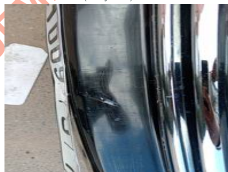
Bouclier avant (Rayure)