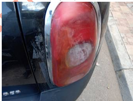
Phare arrière droit (Impact)