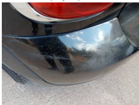
Bouclier arrière (Rayure)