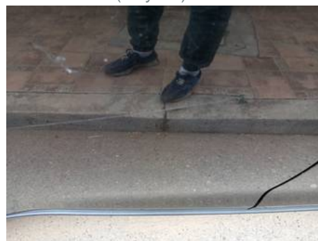
Porte arrière droite (Rayure)