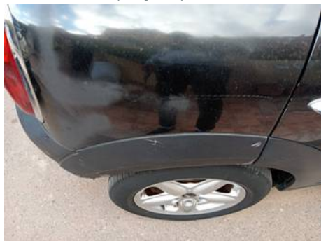
Aile arrière droite (Rayure)