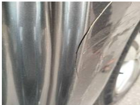
Aile arrière gauche (Défaut aspect)