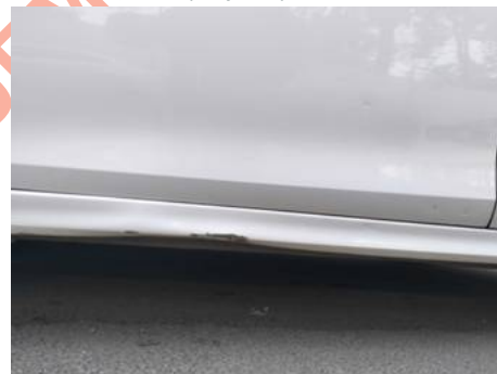
Bas de caisse gauche (Impact)