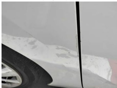
Aile arrière droite (Rayure)