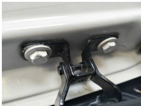
Hayon (Autre Défaut)