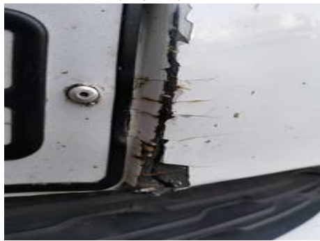
Bouclier avant (Impact)