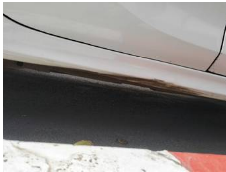
Bas de caisse droite (Impact)