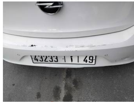
Bouclier arrière (Impact)