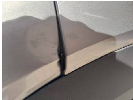
Aile arrière gauche (Impact)