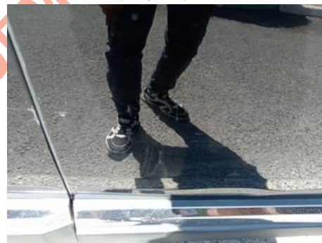
Porte avant droite (Rayure)