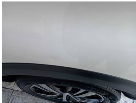
Aile arrière gauche (Rayure)