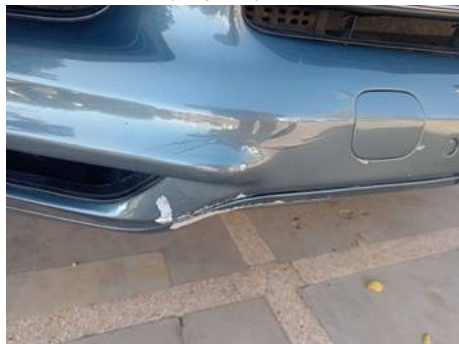
Bouclier avant (Impact)