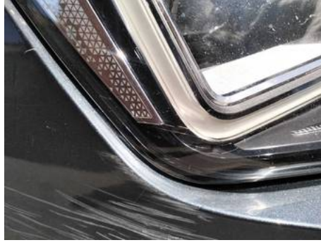
Phare avant droit (Rayure)