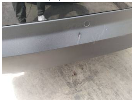
Bouclier arrière (Impact)