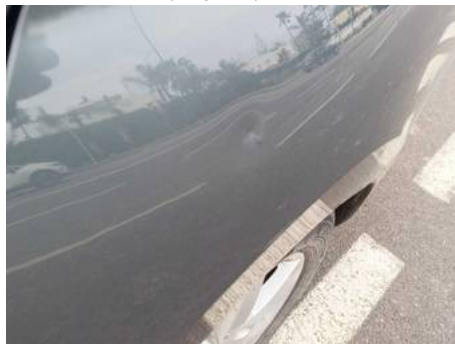
Aile arrière gauche (Impact)