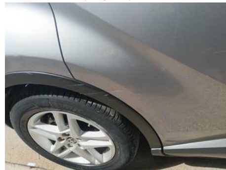
Porte arrière droite (Rayure)