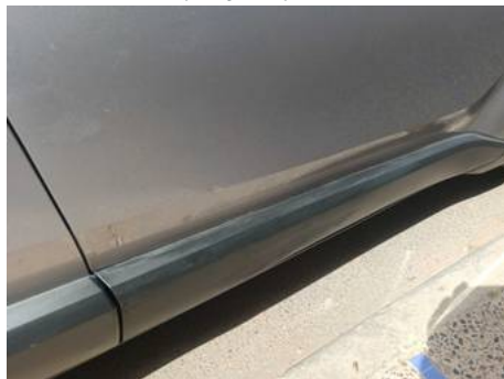
Porte avant droite (Rayure)