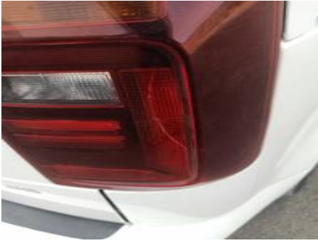
Phare arrière droit (Impact)