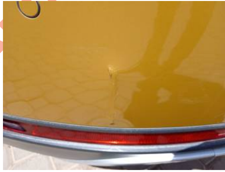
Bouclier arrière (Impact)