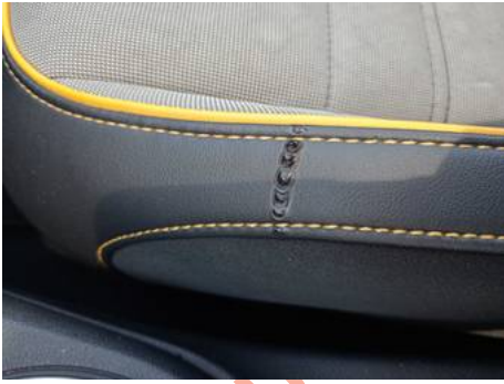
Garniture de siège avant (Trou)