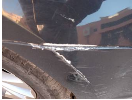
Bouclier avant (Défaut aspect)