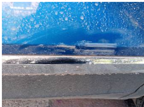
Porte arrière gauche (Rayure)