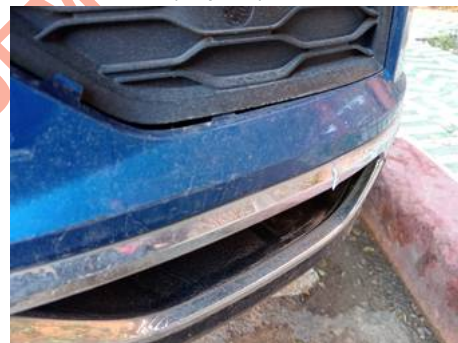
Bouclier arrière (Impact)