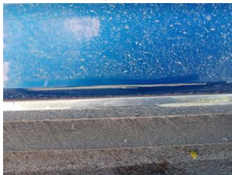
Porte avant gauche (Rayure)