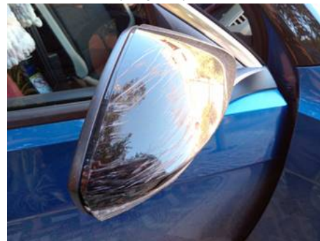
Rétroviseur extérieur droit (Rayure)