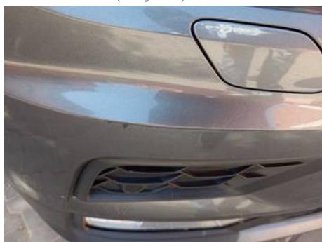
Bouclier avant (Rayure)