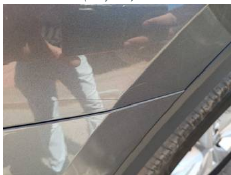
Aile avant gauche (Rayure)