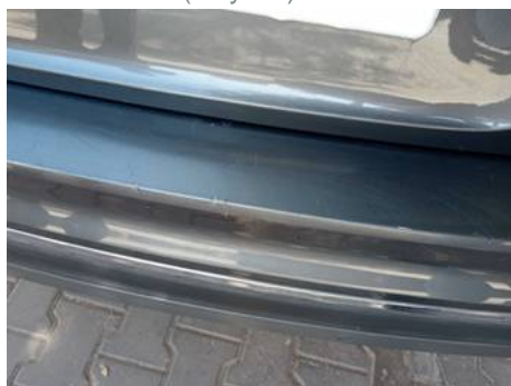
Bouclier arrière (Rayure)