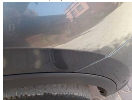
Aile avant droite (Rayure)