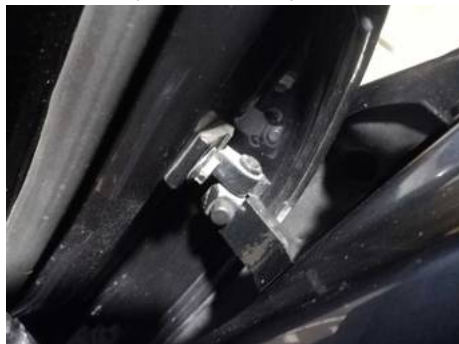
Porte avant gauche (Autre Défaut)