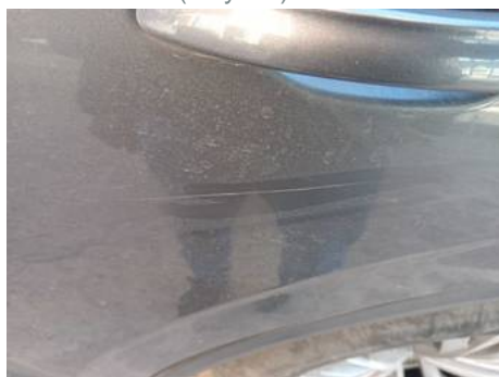
Porte arrière gauche (Rayure)