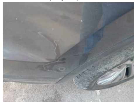
Bouclier arrière (Rayure)