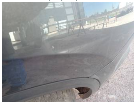
Aile arrière gauche (Rayure)